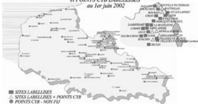
IMPLANTATIONS DES SITES INFORMATION JEUNESSE et POINTS CYB LABELLISES au 1er juin 2002

L'activité Information Jeunesse est régie par les principes de la Charte pour l'Information des Jeunes, qui définit l'information comme « composante fondamentale de l'autonomie, de la responsabilité, de l'engagement social et de la participation citoyenne, de l'épanouissement personnel, de la lutte contre l'exclusion, de la mobilité des jeunes notamment dans le cadre européen ».