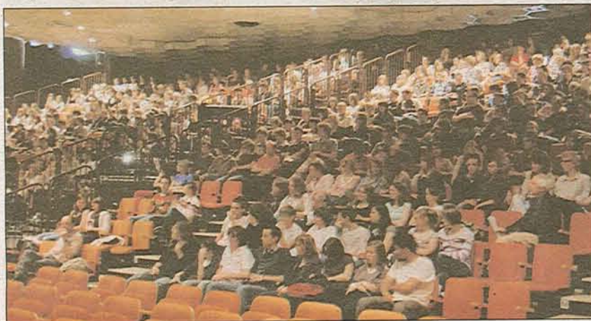
750 élèves ont participé à la séance scolaire du vendredi après-midi.