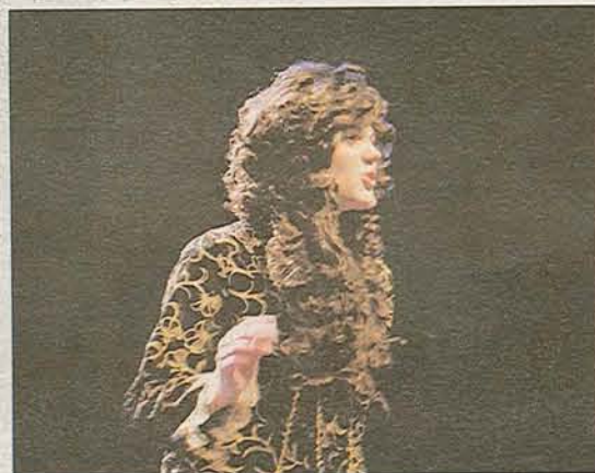
Molière, lui-même, était sur la scène de l'Espace Flandre.