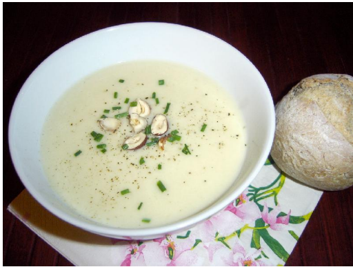
V elouté de Topinambours