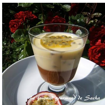
P anna Cotta à la compote de Courges Café ou Thé

12 places prévues, repas à 4,50 euros (boisson comprise)